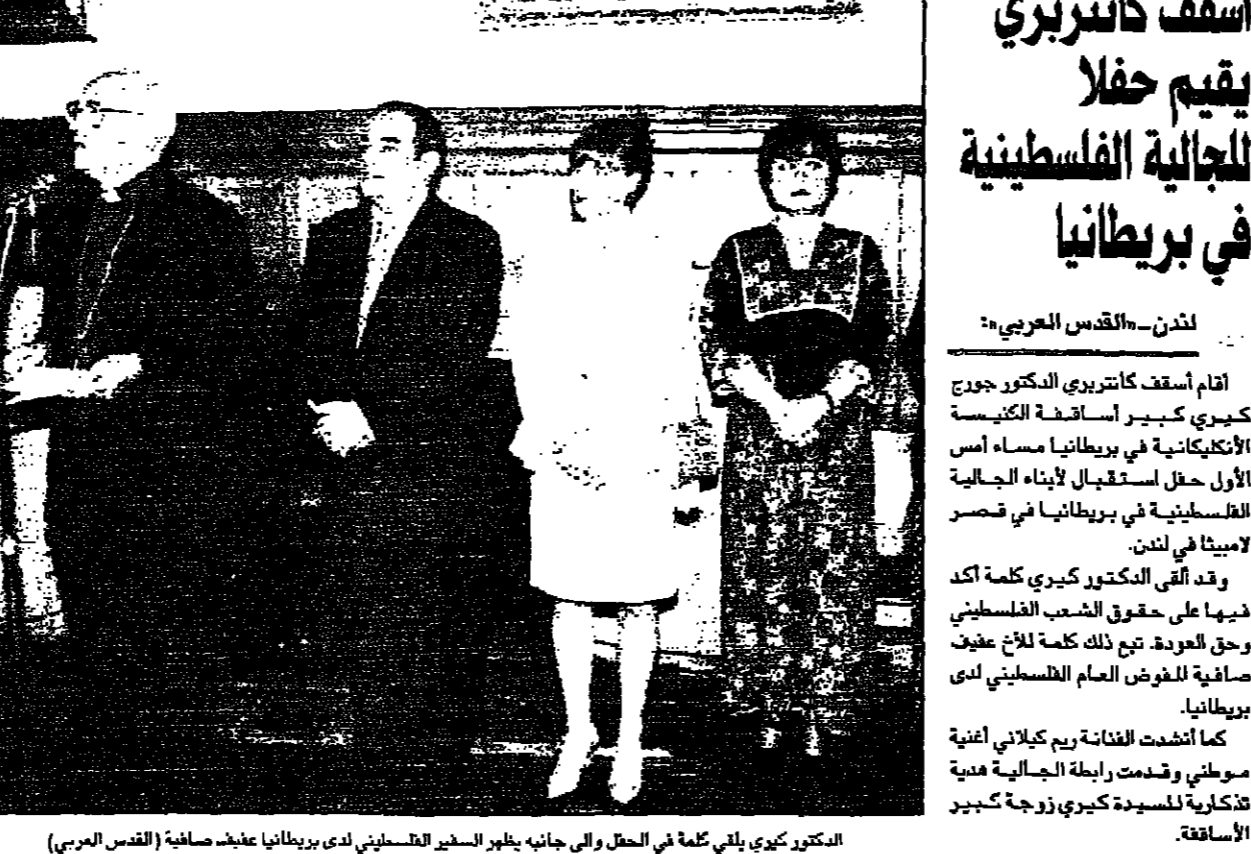
الدكتور كاتنبري يلقى كلمة في الحفل والي جانبه بطاهر الحسير الفلسطيني الذي يبريطانيا عريف صافية

القدس - القدس العربي: قال مسؤول إسرائيلي رفيع أمس الأربعاء إن إسرائيل على استعداد للاعتراف بالانفراج الاقتصادي بين الاتحاد الأوروبي والفلسطينيين.